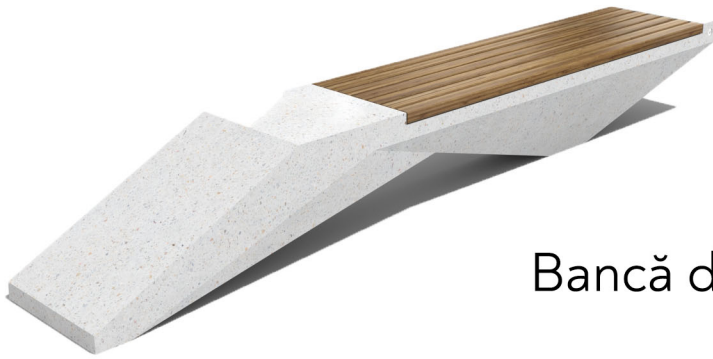
Bancă de beton, tip D. cu lemn

În spatele furnalului, există o bancă improvizată de localnici. Proiectul presupune și consolidarea acestei bănci, dar și introducerea unei bănci de beton în zona, unde este vizibilitate mare asupra peisajului industrial din jurul furnalului.